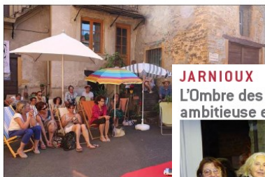
Faire la sieste à l'ombre des mots, c'est possible à Jarnioux.

Au programme, de 10 à 19 heures, des rencontres littéraires, de nombreux jeux et animations pour tous toute la journée, un « Jardin des mômes » avec tournage de film, des « Papa raconte » et des jeux et animations pour les jeunes. Six expositions d'artistes, une cité laoustienne sur l'Ombre, des gros et des petits