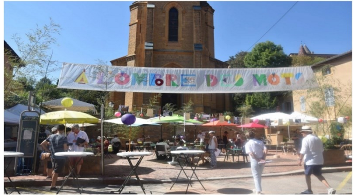
Dimanche à Jarnioux, des visiteurs sont venus dès l'ouverture.

Laurence Chopart - CLP, le mercredi 13 septembre 2023