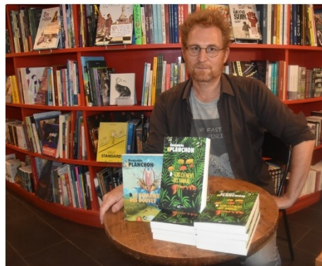
© L.C. Benjamin Planchon a présenté et dédié ses deux derniers livres.

À peine le seuil franchi, les souvenirs de cette enfance merveilleuse et cruelle ressurgissent avec violence. "C'est un restaurateur de tableaux, il essaie de restituer quelque chose qui a été effacé par le temps. Il fait ça avec sa propre vie, il essaie de se reconnecter à une enfance à laquelle il a tourné le dos, mais qui le rattrape inexorablement", ajoutait l'auteur.