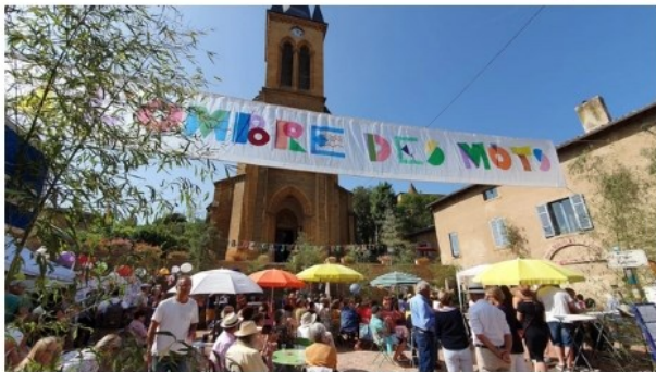
Le village se reconstruit au rythme de la poésie.

Isabelle Martin-Sibille - CLP, le mardi 29 août 2023