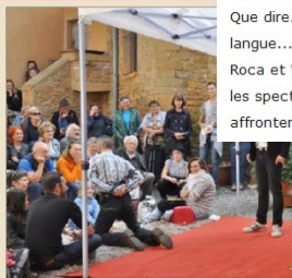
De nombreux artistes ont fait découvrir leur univers au public.