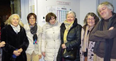
Une partie du conseil d'administration et des membres de l'Ombre des mots.