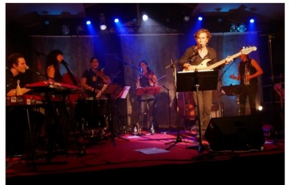
Le septet "Les fourmis dans les mains" a ouvert le festival.