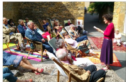
Sieste littéraire lors d'une précédente édition.

dont Marie-Hélène Lafon et Charles Juliet. De nombreuses activités tournant autour des « mots », étaient proposées aux visiteurs sur les dif-