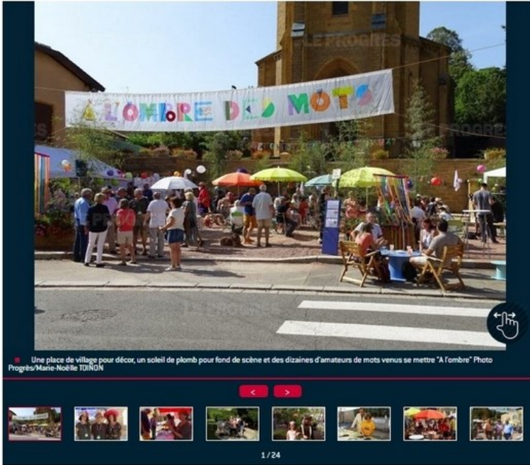
Une place de village pour décor, un soleil de plomb pour fond de scène et des dizaines d'amateurs de mots venus se mettre "A l'ombre"