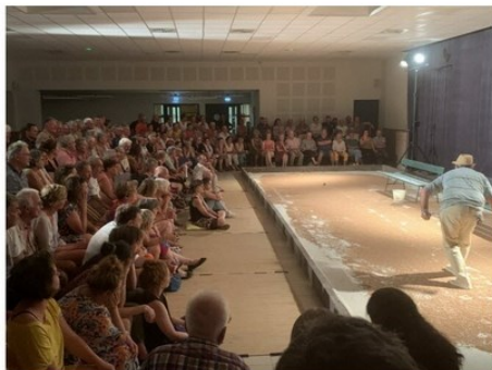
14 / 18 La salle était complète et, pour l'occasion, transformée en terrain de pétanque.

Le festival "A l'ombre des mots" a été lancé vendredi soir 8 septembre, à la salle des fêtes de Liergues. C'est le septet "Des fourmis dans les mains", qui a emballé la salle. Ce samedi après-midi, 26 doublettes se sont affrontées. Puis Sandrine Lefèvre, bibliothécaire, a donné une conférence sur cette discipline. Pour conclure, une pièce des "Pieds tanqués" a été jouée.