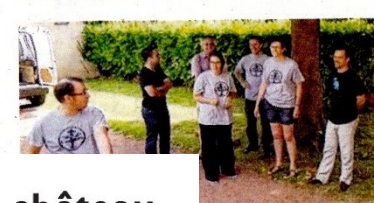
beux artistes, dont les Royal...

parmi de très nombreux autres auteurs, artistes, comédiens, passionnés et amateurs de bons mots... Dans le cadre de ces préparatifs, l'association